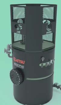
Chaudière vapeur/eau chaude électrique à électrode haute tension jusqu'à 50MW