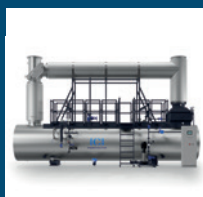
Récupération chaleur fatale