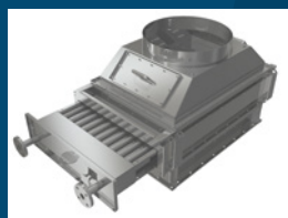
Economiseur pour la récupération de la chaleur des gaz d'échappement