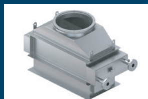
Condenseur pour la récupération de Omsomse inverse la chaleur des gaz d'échappement