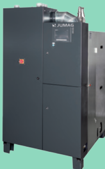
Chaudière vapeur/fluide thermique électrique basse tension jusqu'à 600KW