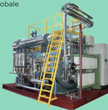
Chaudière Vapeur/eau chaude/fluide thermique électrique basse et moyenne tension jusqu'à 8000KW